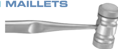
K06308 Maillet Mead 30 - 310g 19 cm