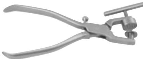
K06660 Broyeur d'os titane 16 mm