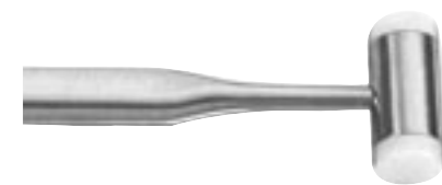
906025 Embout Teflon 25 - 200g 18,5 cm