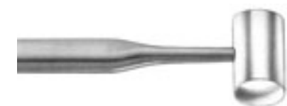
674020 Maillet Cottle 30 - 300g 19 cm