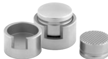
K06740 Ecraseur d'os titane pour pièces plus longues 40 mm