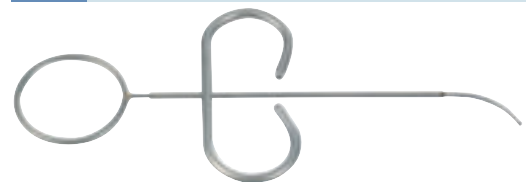
K06548 Seringue d'application 13 cm Droite 1,2