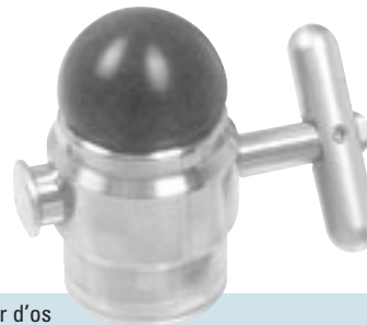
688275 Broyeur d'os