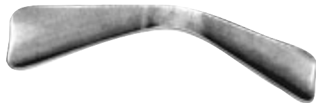
408319 Abaisse-langue adulte