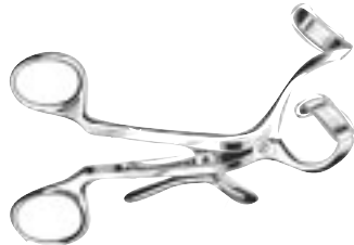
307996 Doyen-Collin 12 cm