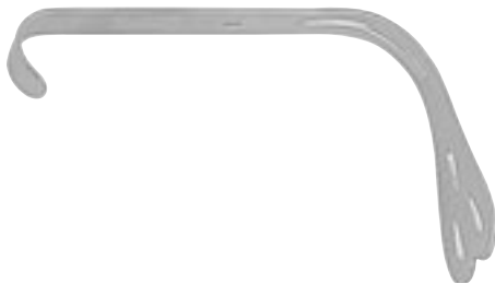
K05258 Abaisse-langue de Wieder 38 mm